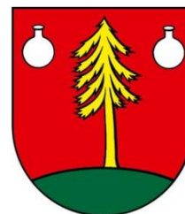
Obrázok 2 Erb obce

Erb obce Sihla tvorí v červenom štíte zo zelenej oblej pažite vyrastajúci zlatý smrek sprevádzaný v horných rohoch štítu striebornými chemickými bankami.